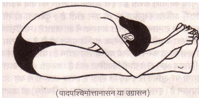
(पादपश्चिमोत्तानासन या उग्रासन)

लाभ: इस आसन से नाड़ियों की विशेष शुद्धि होकर हमारी कार्यक्षमता बढ़ती है और शरीर की बीमारियाँ दूर होती हैं | बदहजमी, कब्ज जैसे पेट के सभी रोग, सर्दी-जुकाम, कफ गिरना, कमर का दर्द, हिचकी, सफेद कोढ़, पेशाब की बीमारियाँ, स्वप्नदोष, वीर्य-विकार, अपेन्डिक्स, साईटिका, नलों की सुजन, पाण्डुरोग (पीलिया), अनिद्रा, दमा, खट्टी इकारें, ज्ञानतंतुओं की कमजोरी, गर्भाशय के रोग, मासिकधर्म की अनियमितता व अन्य तकलीफें, नपुंसकता, रक्त-विकार, ठिगनापन व अन्य कई प्रकार की बीमारियाँ यह आसन करने से दूर होती हैं |